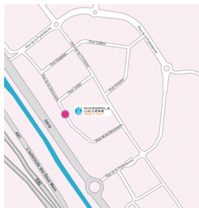
AGENCE TOULOUSE Rue de la Découverte Immeuble Innopolis – Bât A 31 670 LABEGE

Micropole-Univers entend poursuivre son développement en région d'ici 2010 avec un nouveau centre de formation dans le Sud-Est de la France en complément de ses sites de Lyon et Genève.